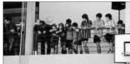
«Tausende» von Zuschauern bejubelten unsere Junioren.