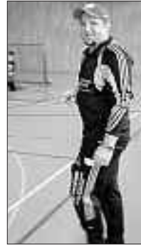
Habi – über jeden Zweifel erhaben, damit jeder Spielzug korrekt läuft.

Um 16.30 Uhr wurden dann durch Speaker Hanspeter Bieri die beiden Halbfinalpaarungen ausgerufen, welche an Spannung kaum mehr zu übertreffen waren. Wie es im Sport aber schon mal vorkommt, standen sich im Final nicht unbedingt die besseren, sondern die glücklicheren Mannschaften gegenüber.