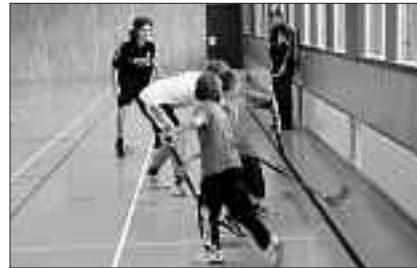
Es wurde um jeden Ball gefightet.