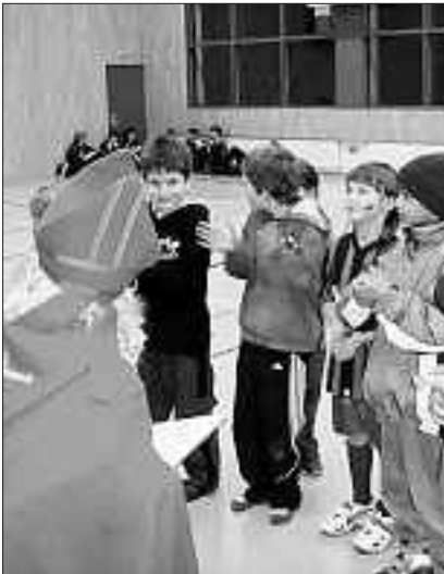
De Samichlaus red üsne E-Juniore chli is Gwüsse.