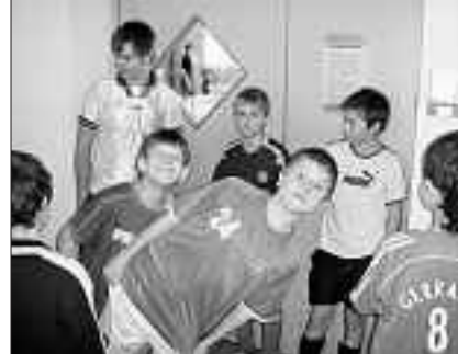
Gute Laune vor dem Spiel – für einen kleinen Spass fand man immer Zeit.